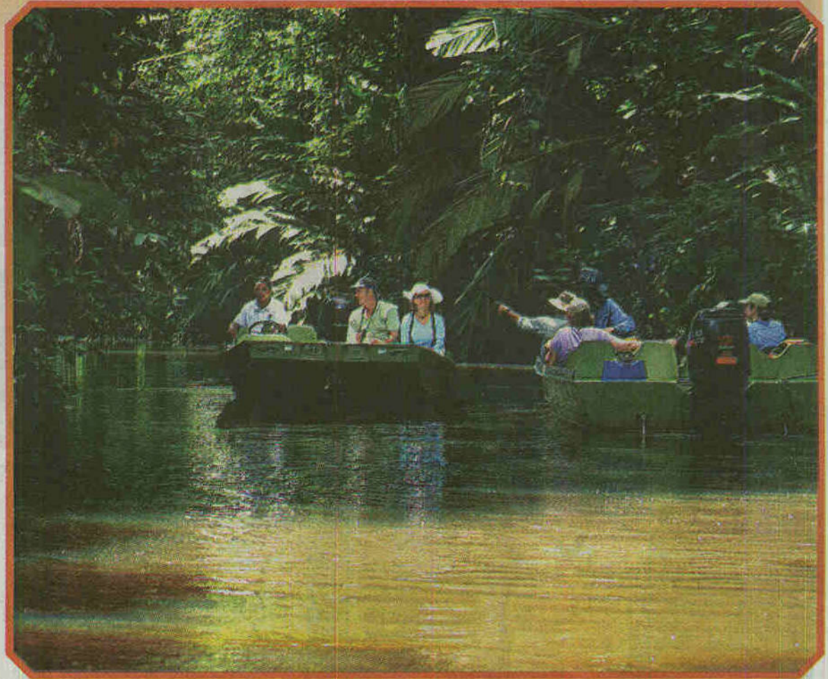
Una de las locaciones fue Tortuguero, ubicada en el Caribe.